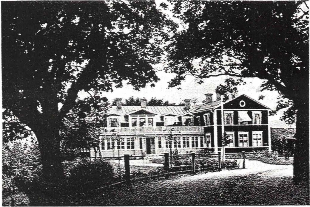
Smedby Gästgivargård i Dala-Husby, Dalarna. En representant för de gästgivargårdar, som under senare tider fått karaktär av turisthotell. ( Nordiska Museet foto ).